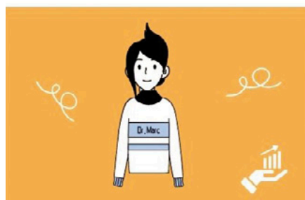
Impulsa la cuenta de resultados

Con una inflación en niveles de doble dígito, toca zafarrancho para recortar costes como sea, especialmente el energético. La tecnología es clave aquí. Existe una conexión muy positiva entre sumarse a la lucha contra el cambio climático y reducir los consumos: de energía, de